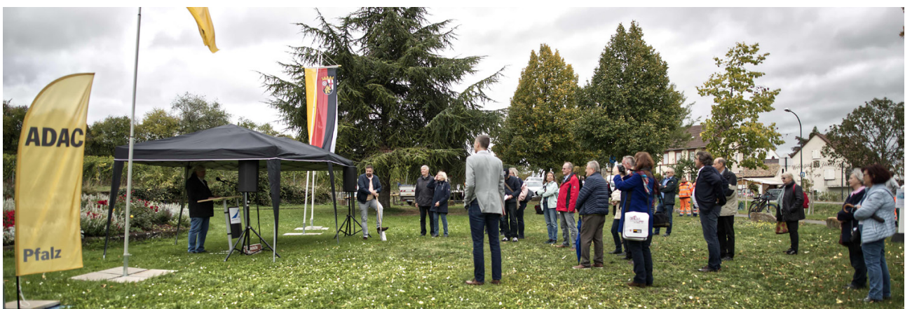
Offizielle Einweihung der Pflanzstrecke in Bad Dürkheim.

Mit der Pflanzung der Mandelbäume wird eine regionale Besonderheit in diesem Streckenabschnitt der Deutschen Alleenstraße hervorgehoben, denn nur im milden Klima der Vorderpfalz wachsen diese Bäume, die mit ihrer Blüte den frühesten Frühling in Deutschland anzeigen.