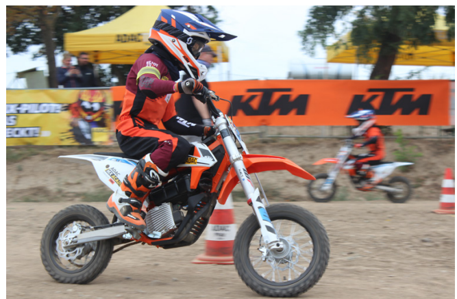
Die elektrische KTM SX-E 5 ist der neue Star der ADAC MX Academy.

Die Bewerbung für die Kurse im Jahr 2021 erfolgt online im Internet: www.adac-mx-academy.de